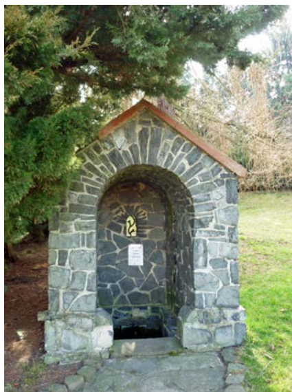
Studánka do které byl sveden léčivý pramen u kostomlatské mariánské kapličky

Tato kaple je delší dobu ve špatném stavu, zejména je zde problém s vodou pod celou stavbou. Obec Kostomlaty projevila zájem o převod kaple s přilehlým pozemkem do svého vlastnictví. V loňském roce došlo k převodu a obec nechala vypracovat projektovou dokumentaci. V letošním roce se již provádějí stavební práce v celkové hodnotě 900 000 Kč. Jedná se o opravu vnějších částí kaple, provedení drenáže a uvnitř rekonstrukce kanálků na vodu od pramene do přilehlé kamenné stavbičky a rekonstrukce podlahy. V příštím roce je plánovaná oprava vnitřní části kaple. Již delší dobu je zrestaurován zmiňovaný obraz P. Marie Pomocné a zatím je umístěn v místním kostele sv. Vavřince. V příštím roce, pokud se podaří zrestaurovat i oltář, by se mohl obraz vrátit na své místo do kaple.