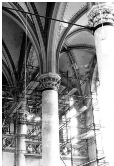
Kostel v průběhu velké rekonstrukce v 60. letech 20. stol.