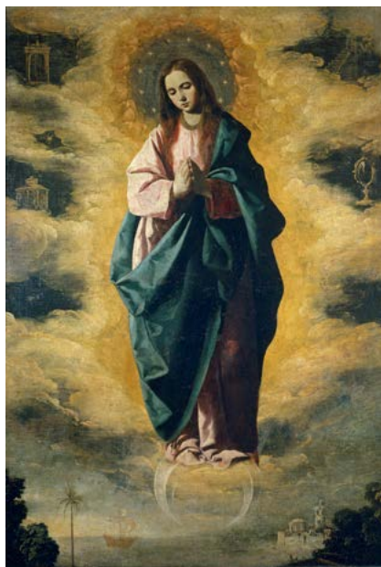
Francisco de Zurbarán (1598–1664): Neposkvrněné početí

Toto učení o neposkvrněném početí Panny Marie závazně vymezil Pius IX. a 8. 12. 1854 je prohlásil za článek víry. Liturgická oslava početí Panny Marie se konala nejprve na Východě, v 9. století přešla z Konstantinopole do jižní Itálie a na Sicílii. Koncem 11. století zavedl tento svátek ve své diecézi sv. Anselm z Canterbury v Anglii a v této době se objevují náznaky této úcty i u nás v tzv. Opatovickém homiliáři. Z Anglie se svátek šířil i jinam. U nás se slaví už kolem roku 1200. V roce 1476 papež Sixtus IV. rozšířil jeho slavení pro celou církev.