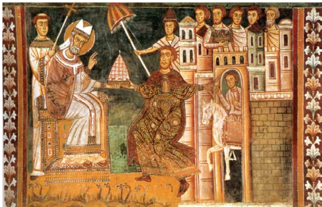
Vyobrazení sv. Silvestra v bazilice Santi Quattro Coronati v Římě

S osobou Silvestra pojí ještě jedna známá legenda: Podle ní chtěla Helena, Konstantinova matka, vést svého syna k židovství, když už se mezitím stal křesťanem. Poté mezi Silvestrem a dvanácti rabíny došlo k hádce, při níž překonal Silvestr zprvu jedenáct rabínů. Dvanáctý usmrtil býka, neuměl však již zvíře probudit k životu. Silvestrovi se to ihned podařilo. Dojati tímto činem se pak císařovna Helena a rabíni dali pokřtít. Kult Silvestra I. se rozšířil do celé Evropy. Jeho svátek se slaví od 5. století.