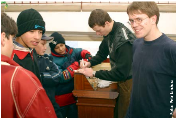
Mladí animátoři s dětmi ve středisku mládeže v roce 2002