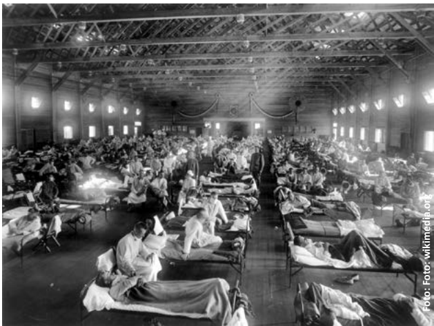
Nemocnice v Kansasu během španělské chřipky v roce 1918

odpovědným dodržováním opatření můžeme negativní důsledky pandemie výrazně omezit (viz Teplice 1715), nekázní naopak zhoršit (viz USA 1918). Třetí: i v pandemii lze žít plným životem, a dokonce tvořit dějiny – na tisíce mrtvých z podzimu 1918 se už téměř zapomnělo, ale vznik republiky slavíme každý rok jako státní svátek. A konečně čtvrté: každá pandemie jednou skončí; zase budeme moci být spolu, podat si ruce, pokropit se svčenuou vodou, navzájem se obejmout. Přeji sobě i vám, aby to bylo co nejdřív, ale zatím vydržme!